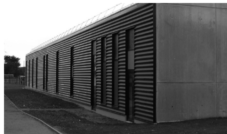
nouvel atelier bois...

Voilà ! Nous vivons une époque difficile : les subventions publiques se réduisent, les charges ne cessent d'augmenter. Nous avons la chance à l'Institut de bénéficier d'une taxe d'apprentissage relativement importante qui nous permettait de tenir à jour nos équipements dans les ateliers. Or, là encore, les modes de calcul nous sont moins favorables. Notre taxe d'apprentissage a donc considérablement diminué l'an dernier (100 000 euros). Nous disposons d'un certain nombre d'entreprises qui nous versent régulièrement leur participation, mais il nous faudrait élargir ce vivier pour compenser la diminution