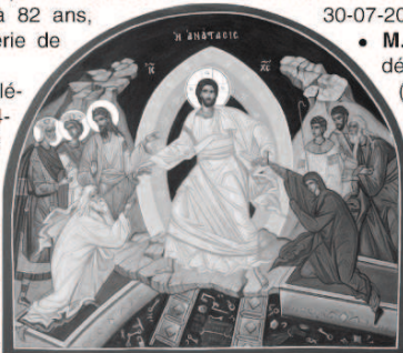
l'icône de la Résurrection