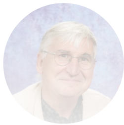
François Callu Communication