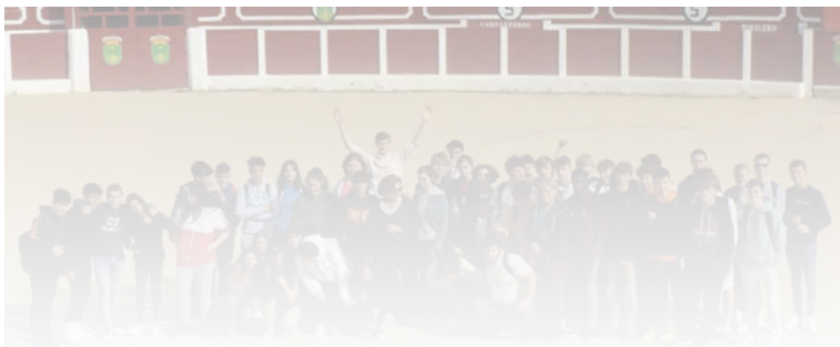
ESPAGNE Hellin (sud-est de Madrid)

Des élèves de l'Institut Lemonnier (DNL) maths en anglais sont allés à Hellin (sud-est de Madrid) en Espagne pour une mobilité Erasmus de mathématiques dans le cadre de l'accréditation enseignement scolaire du programme européen Erasmus 2021-2027. Ce voyage étant financé en quasi-totalité par