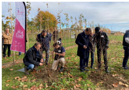
Inauguration de la pépinière. Nos jeunes proposent une démonstration de taille aux invités.

Tout d'abord le transfert sur le site de Caen des filières horticole et service à la personne aura fortement marqué l'actualité du printemps dernier. Nous avons, grâce à la mobilisation des équipes et des jeunes, et dans un temps record, organisé le déménagement du mobilier et du matériel pédagogique, mais aussi préparé l'accueil des 60 jeunes sur le site de Caen avec l'aménagement d'un plateau technique pour le CAP Service à la Personne et Vente en Espace Rural, la création de deux nouvelles salles de classe et la transformation du sous-sol du bâtiment principal en vestiaire à destination de l'ensemble de nos élèves. Parallèlement, des travaux conséquents ont été réalisés au niveau de la serre pédagogique pour rendre l'outil plus performant. Un plateau de maraîchage est également en aménagement avec la volonté d'y obtenir la labélisation Bio. Un partenariat avec la Pépinière Levavasseur permet aux jeunes apprenants de participer à un chantier de pépinière éphémère à Douvres-la-Délivrande dans le cadre de la construction d'un éco-quartier.