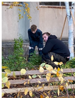
Travail collaboratif entre un jeune de 4EA et un étudiant de BTS.